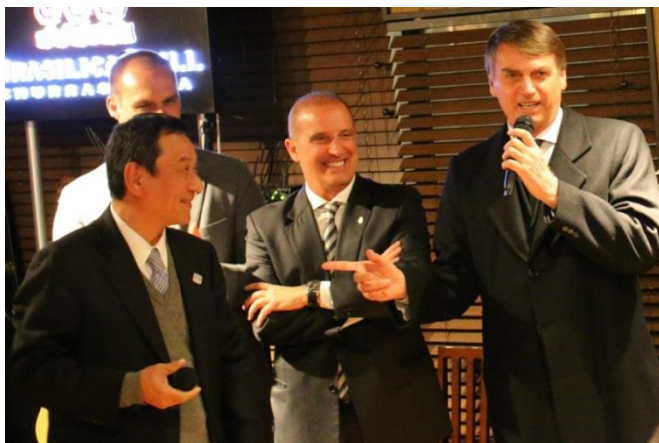
右：Bolsonaro；中：Onyx議員（次期官房長官候補） バック：Eduardo議員（Bolsonaroの息子；185万票で トップ当選） 2月26日：赤坂見附